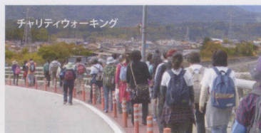
チャリティウォーキング