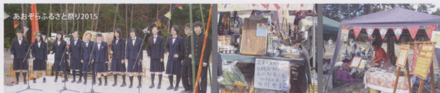
あおぞらふるさと祭り2015

「新緑ウォーク」には約200名、「紅葉ウォーク」には約100名が参加。昨年の「紅葉ウォーク」は地元の方々を交えたお祭りも同時開催され、現役甲府一高生(アカベラ部)も参加しました。